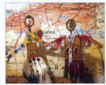
Ci-contre, "Ecce homo", sculpture sur bois d'olivier. Ci-dessus, "Couple de bédouins" réalisé à l'aide d'objets récupérés dans des lots de bric-à-brac.