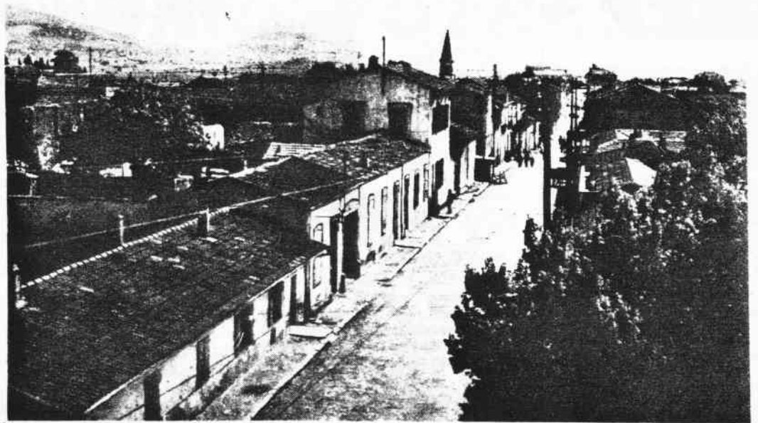
La modeste maison que l'on voit en bas et à gauche de cette photo, est l'une des premières qui furent construites, en 1848-49 par et pour les colons venus de Paris s'implanter sur les bords de l'oued Fendek.

Mais nous, " pied noir ", nous avons la satisfaction de pouvoir dire avec force : « Nous avons été fidèles à l'idéal des anciens pionniers : vaincre l'anarchie,